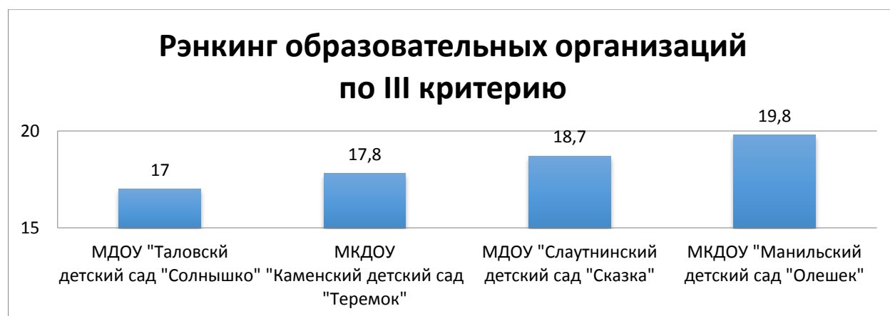
Диаграмма 3. Рэнкинг образовательных организаций по критерию «Доброжелательность, вежливость, компетентность работников»

Рэнкинг образовательных организаций по критерию «Доброжелательность, вежливость, компетентность работников» представлен на Диаграмме 3.