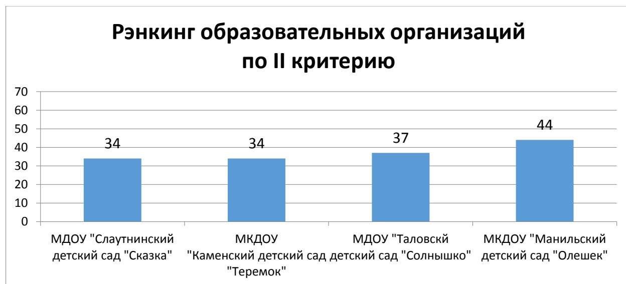
Диаграмма 2. Рэнкинг образовательных организаций по критерию «Комфортность условий, в которых осуществляется образовательная деятельность»

Рэнкинг образовательных организаций по критерию «Комфортность условий, в которых осуществляется образовательная деятельность» представлен на Диаграмме 2.