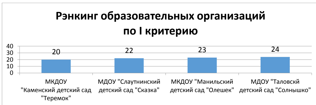
Диаграмма 1. Рэнкинг образовательных организаций по критерию «Открытость и доступность информации об образовательной организации»

Критерий оценки качества деятельности образовательной организации, касающийся комфортности условий осуществления образовательной деятельности, рассматривался на основе показателей, характеризующих материально-техническое и информационное обеспечение; условия для охраны, укрепления здоровья и организации питания; условия для индивидуальной работы с обучающимися, развития их творческих способностей и интересов; наличие дополнительных образовательных программ; возможности оказания психолого-педагогической помощи обучающимся; условия организации обучения обучающихся с ограниченными возможностями.