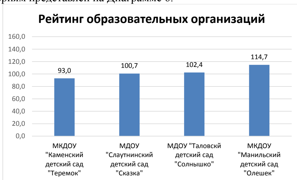
Диаграмма 6. Рейтинг качества образовательной деятельности образовательных организаций по сумме баллов по всем критериям.

Рейтинг образовательных организаций по сумме баллов по всем критериям представлен на Диаграмме 6.